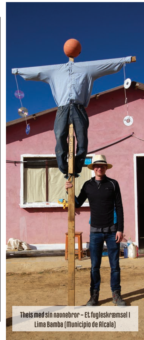
Theis med sin navnebror - Et fugleskræmsel i Lima Bamba (Municipio de Alcala)