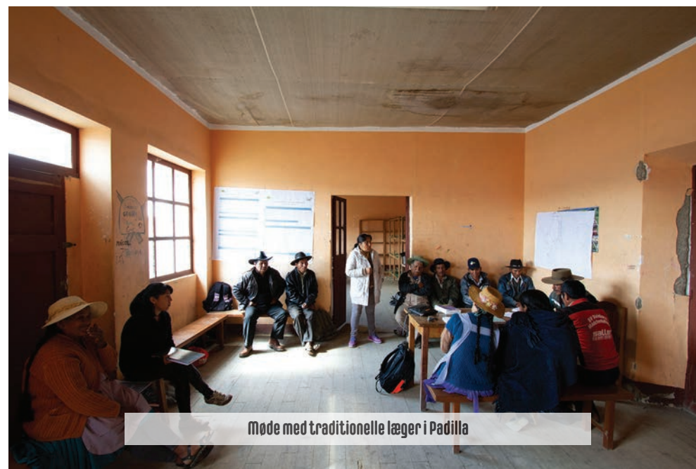
Møde med traditionelle læger i Padilla