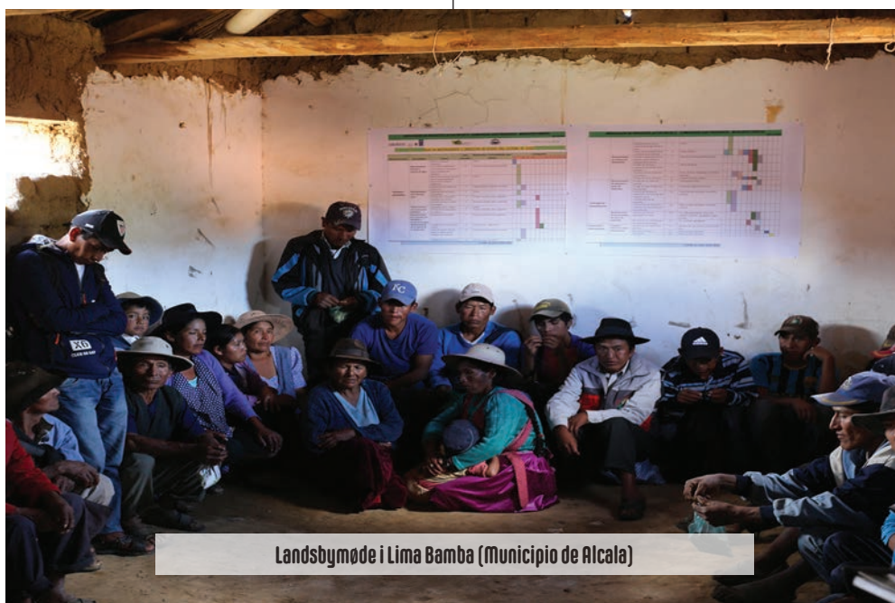
Landsbymøde i Lima Bamba (Municipio de Alcalá)