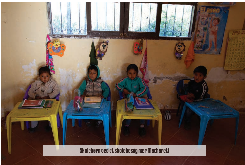
Skolebørn ved et skolebesøg nær Machareti