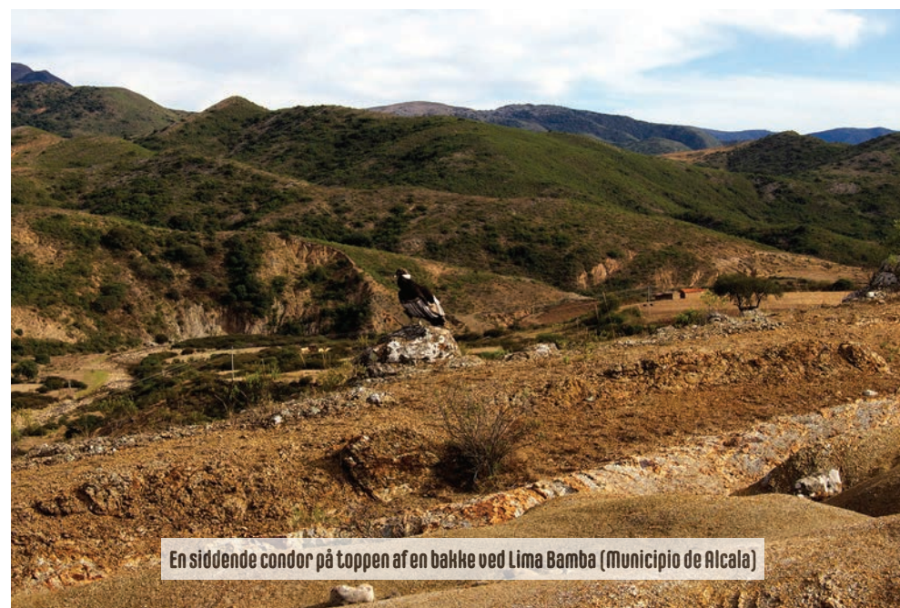
En siddende condor på toppen af en bakke ved Lima Bamba (Municipio de Alcalá)