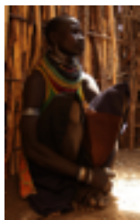
To nye projekter Uganda finansieret Side 1

Llamerofolket Vi hjælper de marginaliserede Side 6-7