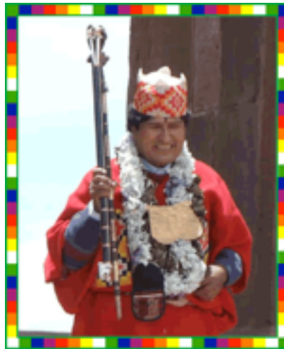
Evo Morales ved sin indsættelse 2006